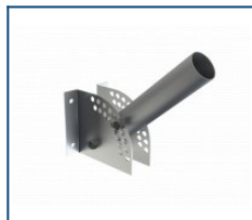
Настенный кронштейн для консольного крепления с регулировкой угла наклона