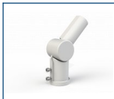
Кронштейн поворотный 90 град. Caiman / Unit