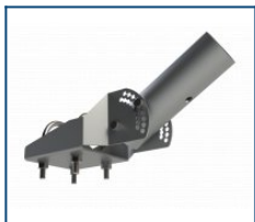
Кронштейн поворотная консоль (-20 до 75) (комплект)